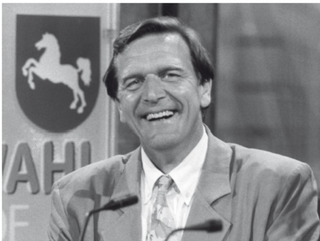
Abb. 22: Absolute Mehrheit! Schröders Freude am Wahlabend 1994 war zunächst größer als bei den Genossen.

Schoppe hatte so auf ihrem Gebiet großen Spielraum. 98 Überhaupt schien die Regierung Schröder von der Mischung aus dem geselligen Miteinander 99 auf der einen Seite und der autokratischen Entscheidung auf der anderen Seite zu leben.