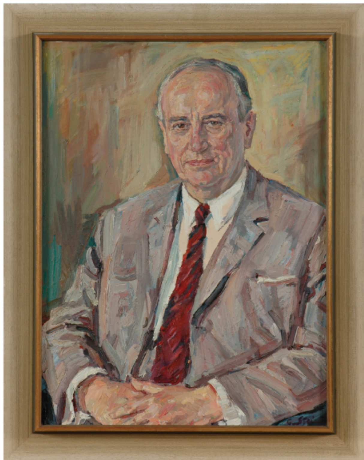
Abb. 10: Georg Diederichs, Niedersächsischer Ministerpräsident 1961–1970; Künstler: G. Stein