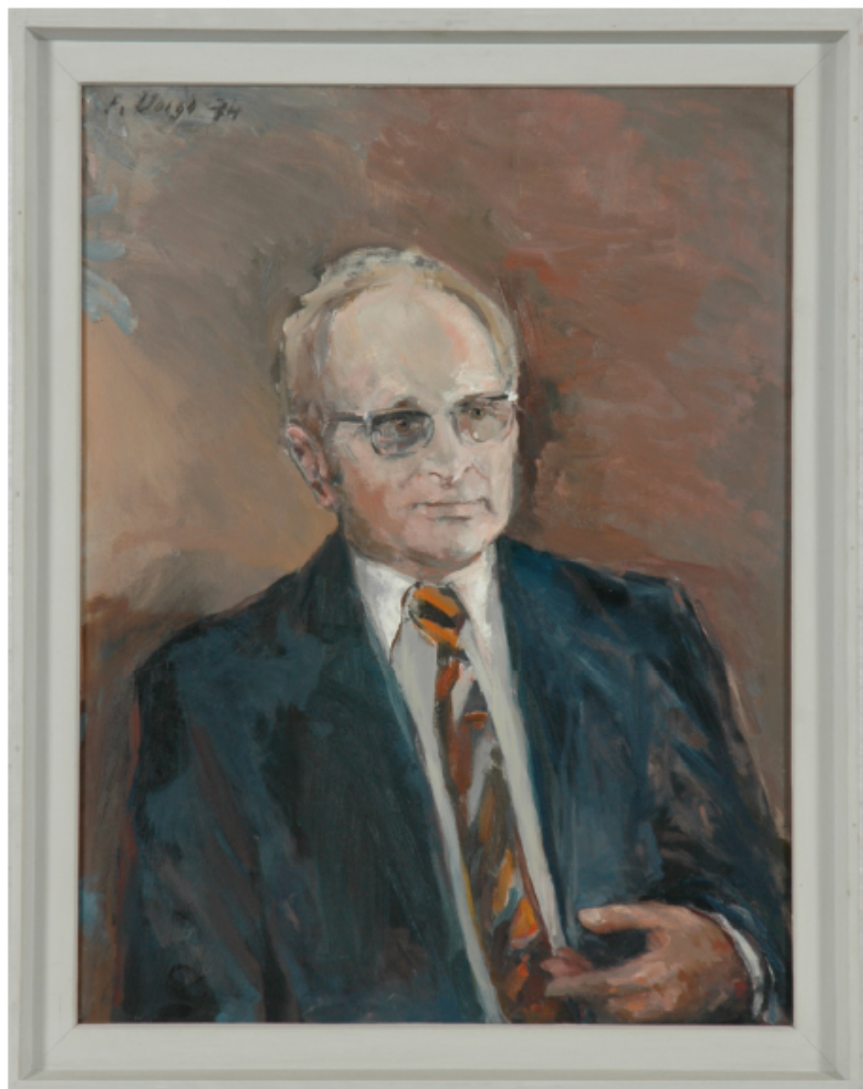
Abb. 14: Alfred Kubel, Niedersächsischer Ministerpräsident 1970–1976; Künstler: Peter Voigt