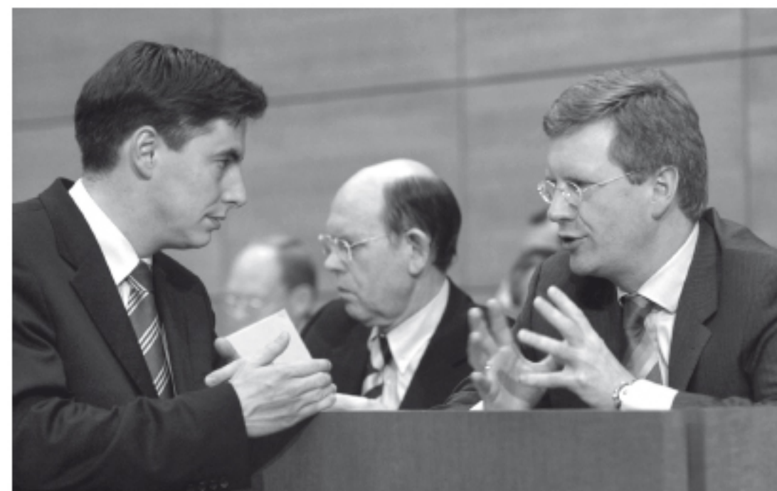
Abb. 32: Dem einen das Land, dem anderen die Partei.

Mit der Gabe, polemisch zuspitzen zu können, kämpferische Reden zu halten und den eher raubeinig geprägten Teil der Basis zu begeistern, stärkte er Wulff den Rücken. McAllisters öffentliche Auftritte konnten kernig vermarktet werden, sodass der Eindruck entstand, der Fraktionschef und der Ministerpräsident würden an das Duo Hasselmann und Albrecht anknüpfen: Wulff in der Rolle des ehemaligen Regierungschefs Albrecht und McAllister als Hasselmann. Der junge Schotte glich Wulffs Schwächen im Umgang mit der Partei aus. Er war die Nummer zwei hinter Wulff und wurde – wenig überraschend – im Juni 2008 von Wulff zum Landesvorsitzenden der CDU in Niedersachsen vorgeschlagen. Fast einstimmig wurde McAllister von den rund 400 Delegierten gewählt. 98